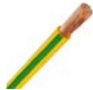
Cable de Puesta a Tierra