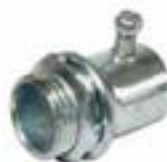
Accesorios tuberías livianas (EMT)