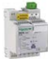
Rele de Protección