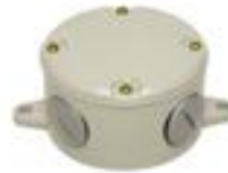
Cajas de Derivación