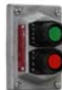
Botoneras para Area Corrosivas