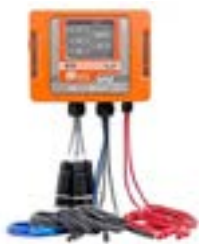
Analizador de Redes