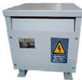
Trifásicos secos baja tensión barnizados

CMEI Expertos en ventas de SOLUCIONES ELÉCTRICAS