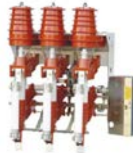
Seccionadores Cut Out