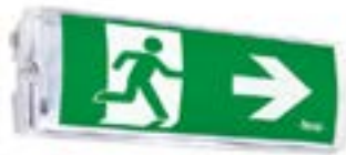
Luces de Emergencia