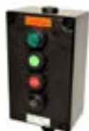
Estacion de Control