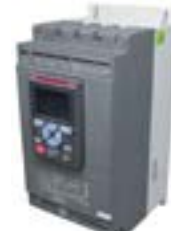
Arrancadores eléctricos para motores