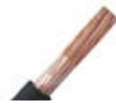
Uso móvil y sumergibles