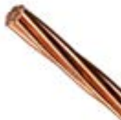
Cables de Cobre