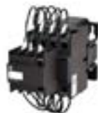
Contactores de Compensación