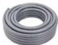
Tuberias Flexibles Ex