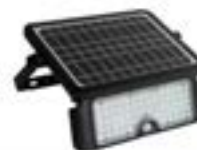
Reflectores Solares Abatibles