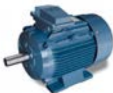
Motores Electricos IEC