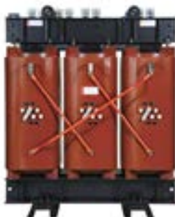
Transformadores secos desde 10 k