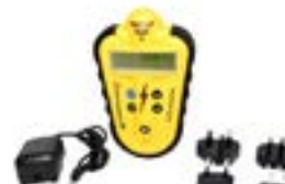
Detectores de Tormenta