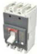
Interruptores en Caja Moldeada