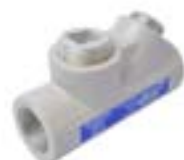
Sellos Cortafuegos y Compuestos