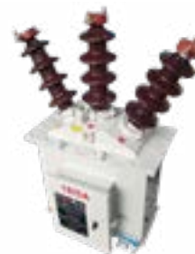
Mixtos de medición