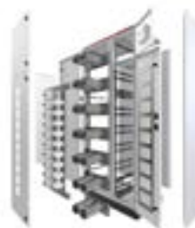
Tableros de Banco de Condesadores en Baja Tension