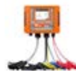
Analizador de redes