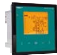
Reguladores de Factor de Potencia