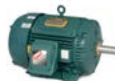
Motores Electricos Nema