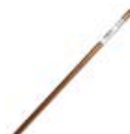
Varillas de Cobre