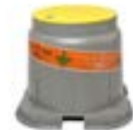
Cajas de Registro de PVC