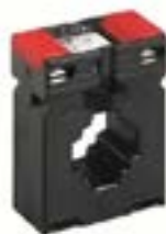
Equipos de Medición Para Tableros