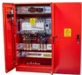
Tableros de arranque con variador de velocidad