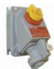
Enchufes y Tomas Industriales