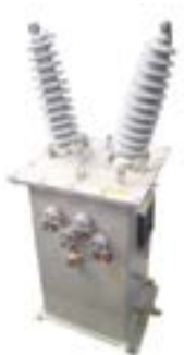
Monofásicos en aceite