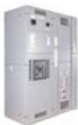
Tableros Generales de Distribucion en Baja Tension