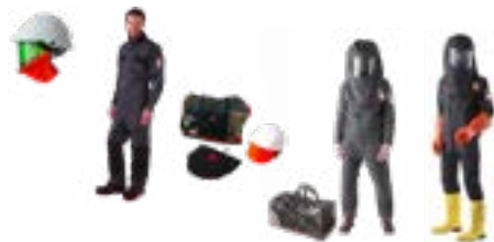
kit protección contra arco eléctrico