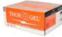
Mejoramiento de Puesta A Tierra