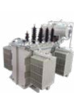
Transformadores en aceite mineral y vegetal