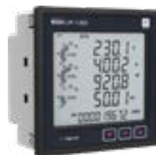
Medidores de Energía