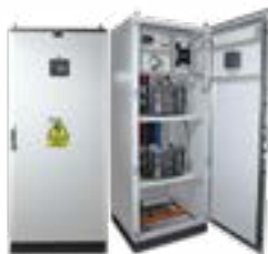
Tableros de arranque con variador de velocidad