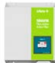
Filtros Activos de Armónicos