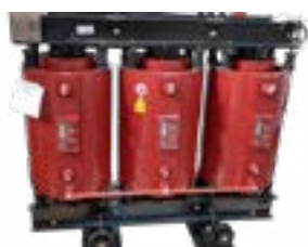
Trifásicos secos media tensión encapsulados