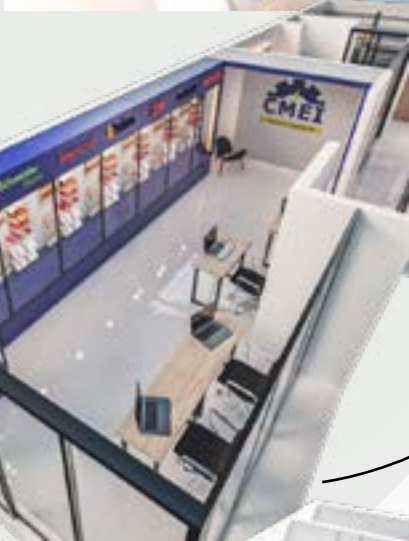
Sala de ventas con amplio showrom