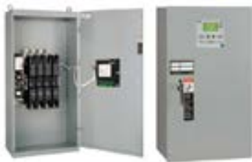
Tableros de trasferencia automática y manual