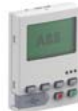
Panel de control LCD