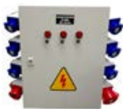
Tableros de faena