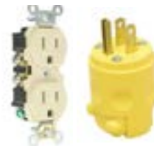
Enchufes y Tomacorrientes Nema