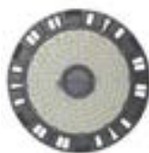
High Bays Led