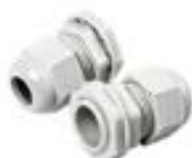
Prensaestopas y Conectores