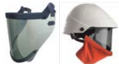
Careta contra arcoeléctrico