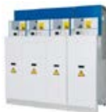
Aislamiento en gas (Gis)