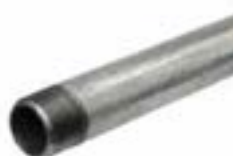
Tuberías pesadas (RIGID)