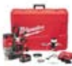
Taladros y Llaves de Impacto