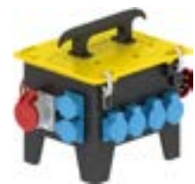
Caja portatil de goma maciza