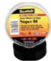
Cintas Aislantes Vinilicas Profesionales (Super 33)