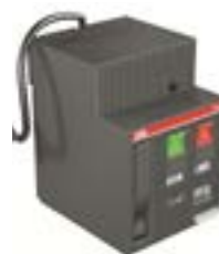
Controladores de motor