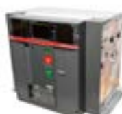
Aislamiento a aire