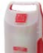
Estuche y caja portaguates