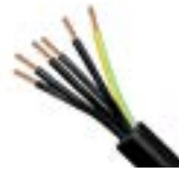
Fuerza con armadura