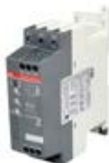
Arrancador electrónico para bombas