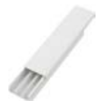
Canaletas y Accesorios