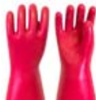
Guantes de algodón