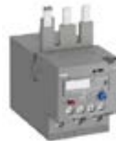
Reles de sobrecarga