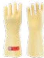
Sobreguantes de cuero