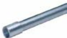
Tubería semipesada (IMC)