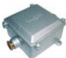
Cajas de Derivacion