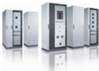
Tableros para mineria bajo estandar Nema o IEC