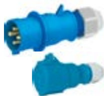
Enchufes y Tomacorrientes IEC