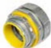
Accesorios tuberías felexibles