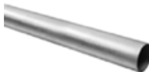
Tubería liviana EMT