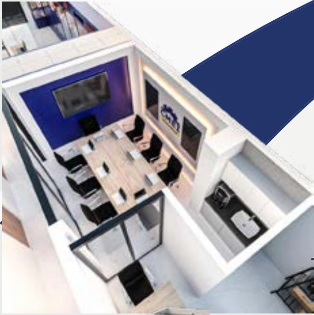
Sala de reuniones "Chachani"