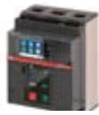
Interruptores en Aire