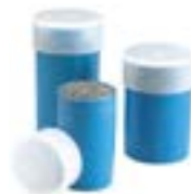
Moldes de Grafito Capsula de Soldadura