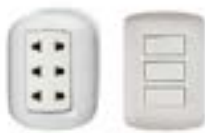
Interruptores y Tomacorrientes