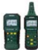
Detector de cables