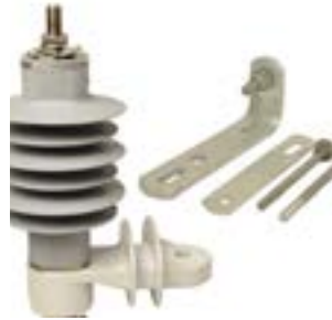
Pararrayos Media Tensión