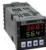
Controladores de temperatura